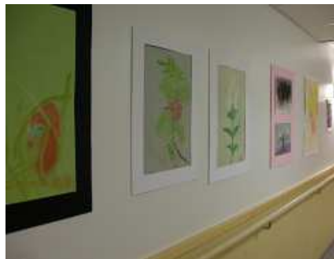
1階廊下 入居者の作品