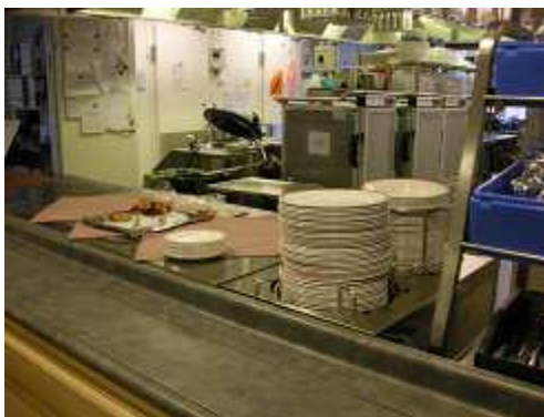
自立者向けレストラン セルフが基本。ミニ売店も併設