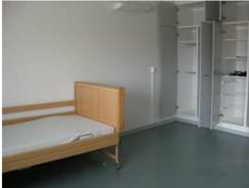
自立型 1ルームのみ