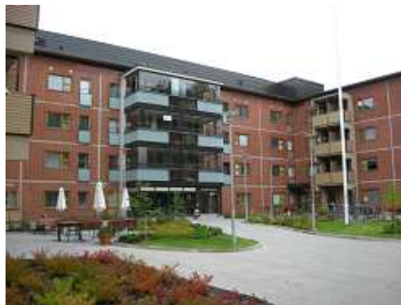
コの字型の中央部。真中が玄関。 中央の黒い部分が各階全てサン・ルーム