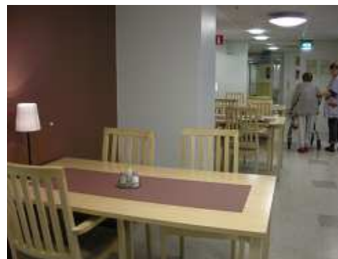
左につながる食堂。意外と小さい。 おやつを食べている人が数人。

自立棟も、日本の要介護2~3レベルの人が結構いるような雰囲気。 認知症も結構多いとのこと。(ポリシーは自立支援・ADLの向上...おそらく)