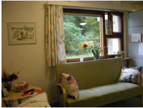
ショートステイのリビング 1回のステイは1~2週間