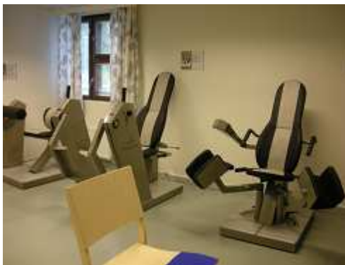
1階のソフト・ジム (HUR)