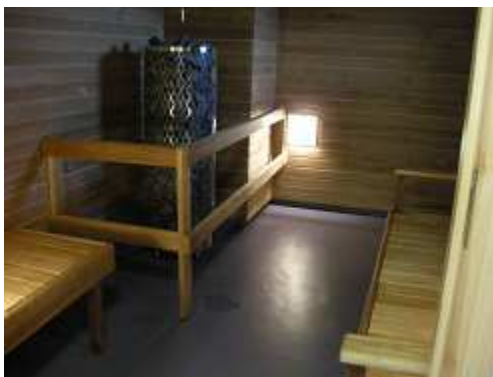
サウナ！フロアごとにある