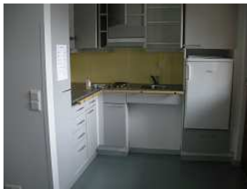
自立型のキッチン 収納がすごい！