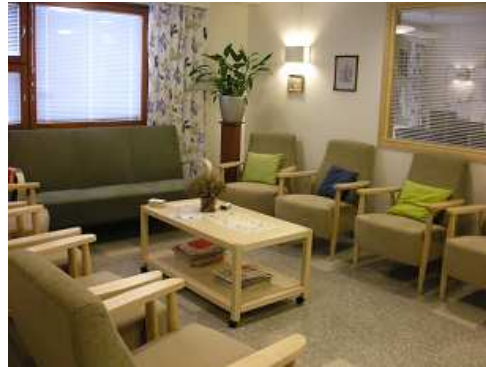
デイサービスの3スペースの一つ 16人で3スペースは十分すぎる！