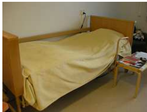
GH居室の備え付け電動ベッド