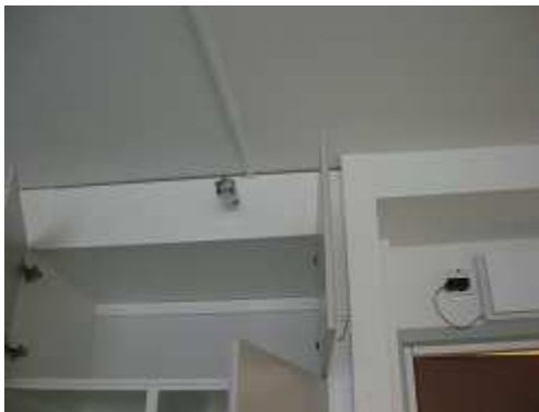
自立型 スプリンクラーが天井でなく、横壁(上方)に。