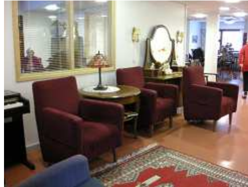
GHの団欒ルーム、奥が食堂