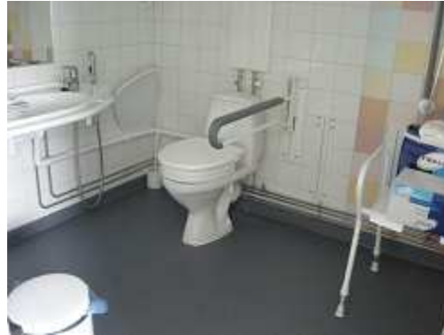
自立型 トイレ&シャワー 将来の介助・介護も考えた設計