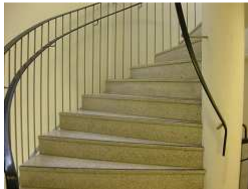
30年前の建築ゆえ階段がオシャレ だけど危険ならせん階段...